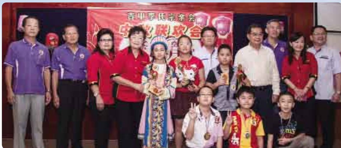
吉中李氏宗親會「慶祝中秋節暨卡拉OK華語歌唱比賽」高年組優勝者合影