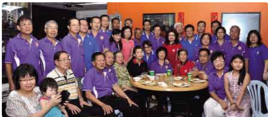
213年12月，馬來西亞吉中李氏宗親會「慶祝2013年冬至湯圓節」合影