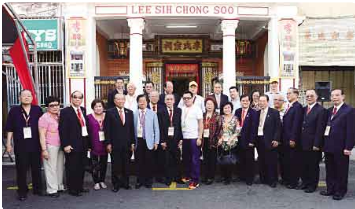
前來祝賀的台灣、香港、菲律賓、馬來西亞、新加坡、印尼、中國大陸等地區的宗親，與「馬來西亞檳城李氏宗祠」的主人們合影。

「懷賢廳」的前身是檳城李氏宗祠，1925年初置階段，曾為內地宗親初臨檳城的落腳泊宿處，也是各派宗親匯聚籌謀的場所，歷史地位不言而喻。宗祠座落在一排老式街屋中，屋高兩層，門面侷狹，為典型華人長屋型態。大門內縮約2米，故門外有廊，可避日晒雨淋；門楣匾曰：「李氏宗祠」；門聯右云：「仙李盤根千枝萬葉」；左云：「老彭開派九流百家」；明白揭示這是李氏宗門。