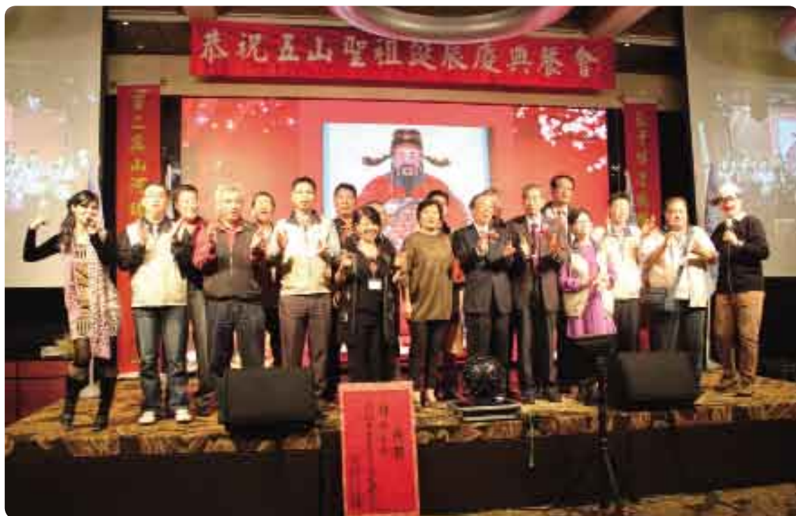
2013年11月12日晚間，在新北市三重區的「彭園湘菜館」舉辦餐會聯誼，「金門旅台李氏宗親會」與來自大陸浦園的宗親，現場高歌同歡，其樂融融。