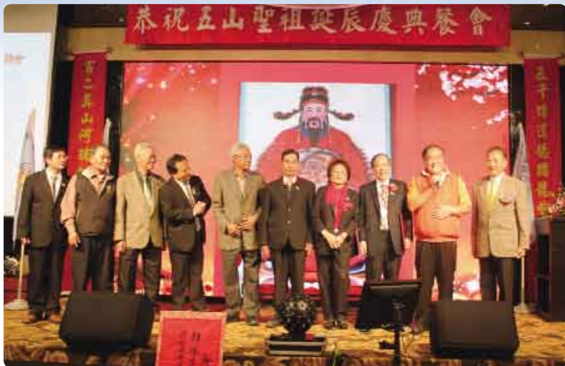
「金門旅台李氏宗親會」慶祝「五山祖誕辰在台舉行36週年紀念慶典」，許多台灣各縣市的宗親會，都派代表前來祝賀，共聚一堂。