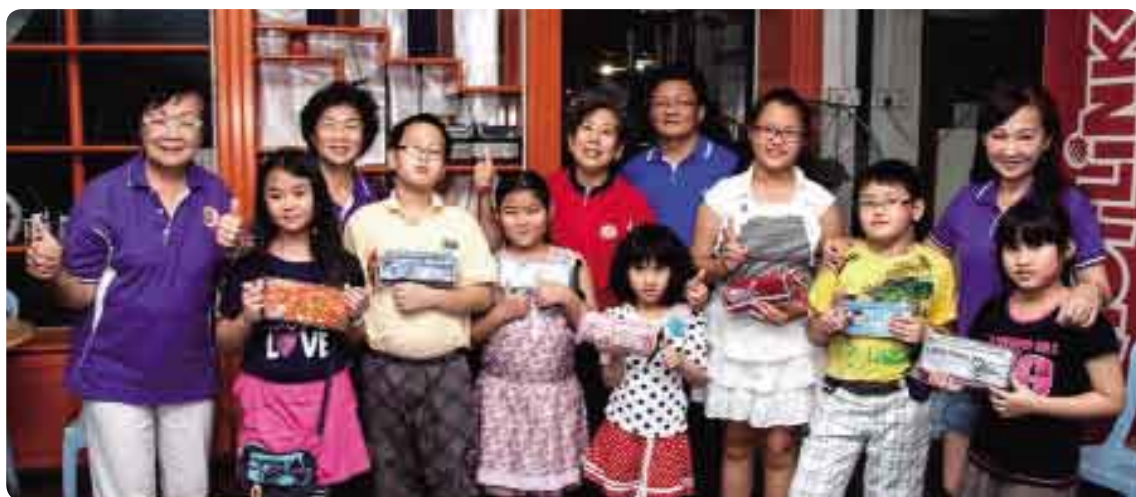
213年12月，吉中李氏宗親會「慶祝2013年冬至湯圓節」搓湯圓比賽得獎者合影。