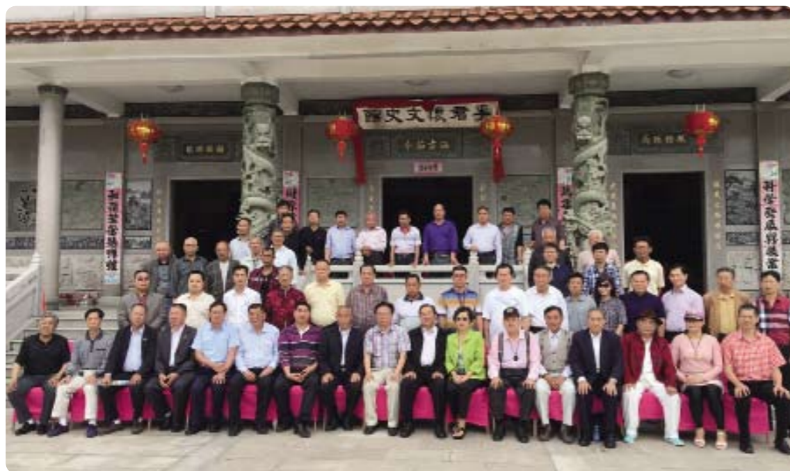
2016年5月2日上午，世界李氏宗親總會「敦宗訪問團」與「閩南李氏君懷堂」的宗親們，在「李君懷文史館」前的廣場合影留念。