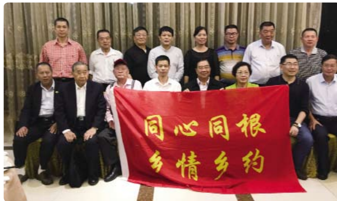
2016年5月2日晚間，「世界李氏宗親總會」敦宗訪問團與「廈門市海滄區僑聯」進行餐會交流時合影留念；此次的敦宗之行，也就在今晚圓滿結束。