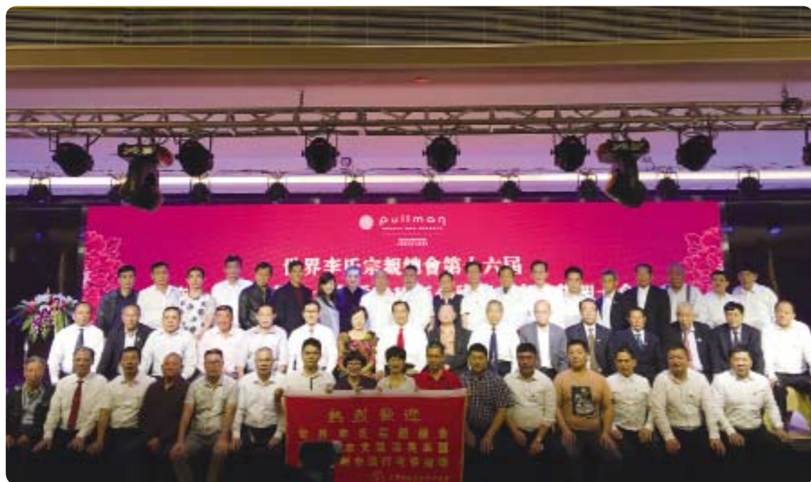
2016年4月29日，「世界李氏宗親總會-敦宗訪問團」與「石獅市隴西文史研究會」於石獅市的鉑爾曼酒店進行「考察座談會」之後，雙方合影留念。