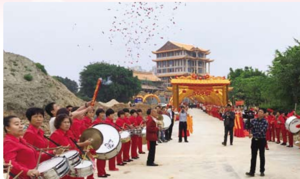
2016年4月30日，世李「敦宗訪問團」拜訪位於福建省晉江市的「中國福建閩南李氏宗親聯誼總會」，並參觀建設中的「閩南隴西堂」(圖中遠方的建築)。