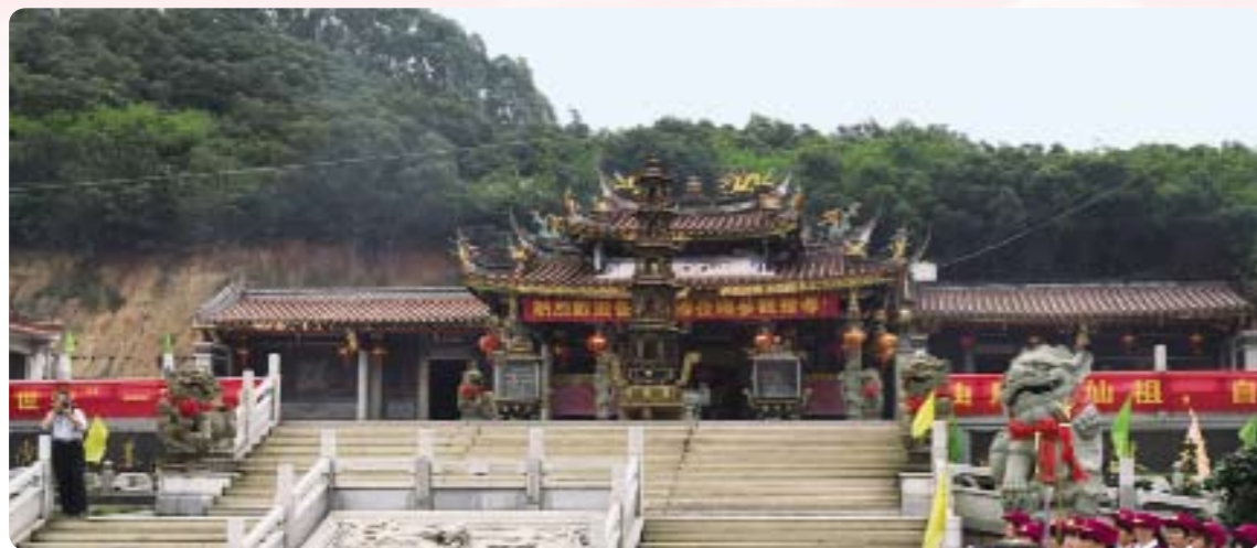
上圖：2016年5月2日上午，世李總會「敦宗訪問團」拜訪福建省泉州市的「閩南李氏君懷堂」。