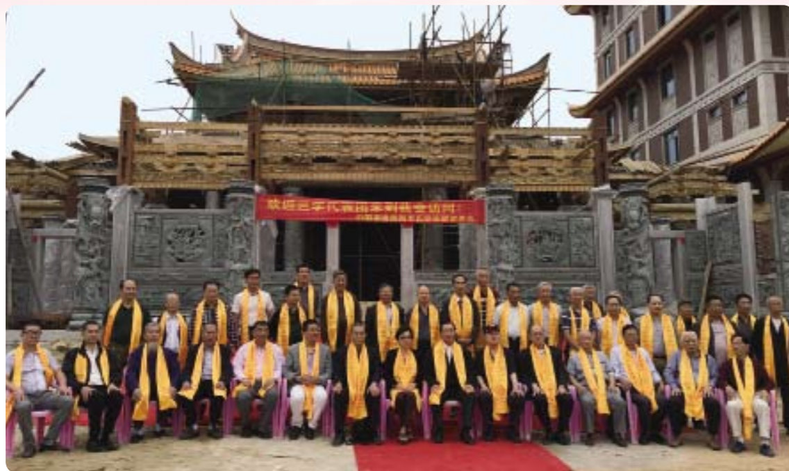
2016年4月30日，「世界李氏宗親總會-敦宗訪問團」與「中國福建閩南李氏宗親聯誼總會」，在建設中的「閩南隴西堂」前合影留念。