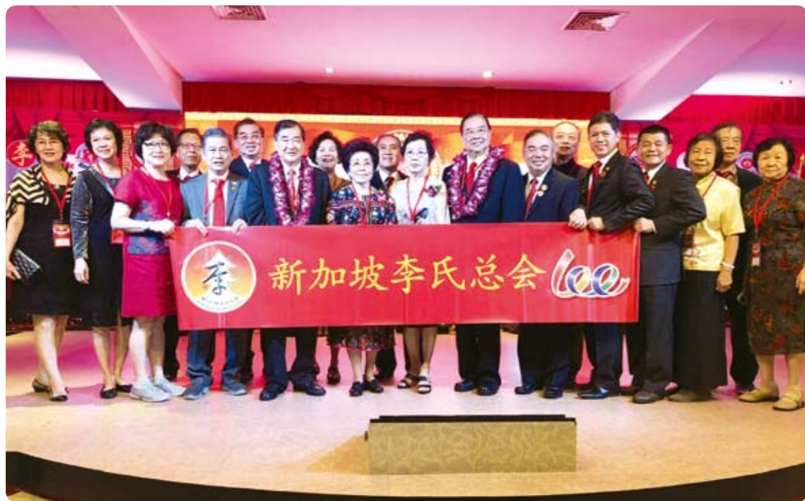
下圖：與印尼峇淡地理位置相近的新加坡宗親，組團前來慶賀。