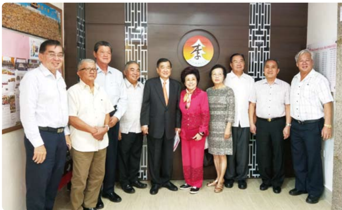
下圖：眾人於「新加坡李氏總會」的會所合影留念。