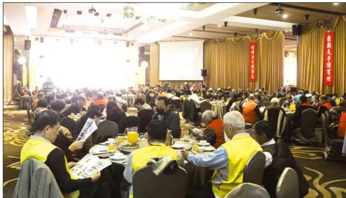
2021年1月3日上午，台灣李氏宗親總會舉辦「第14屆第1次會員代表大會暨懇親祭祖典禮」；圖為會場內台下的情形。