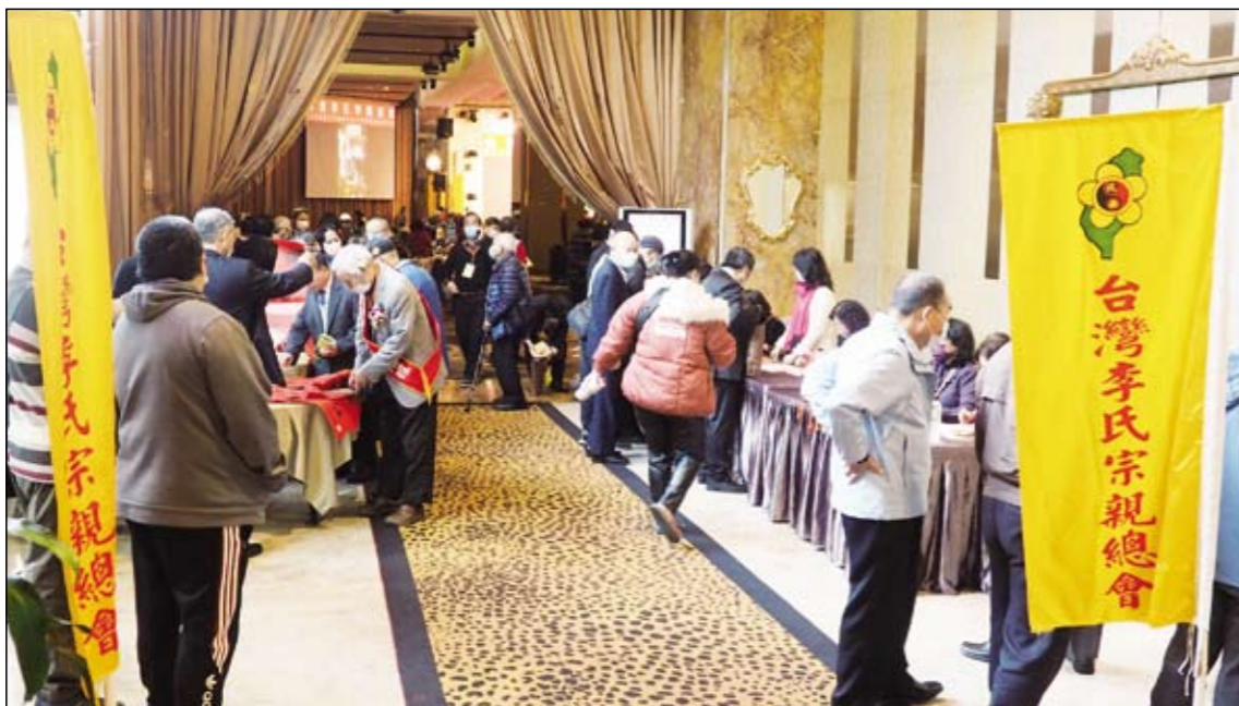
2021年1月3日上午，台灣李氏宗親總會「第14屆第1次會員代表大會暨懇親祭祖典禮」，在新北市新店區的彭園會館舉辦；圖為大會報到區的情形。